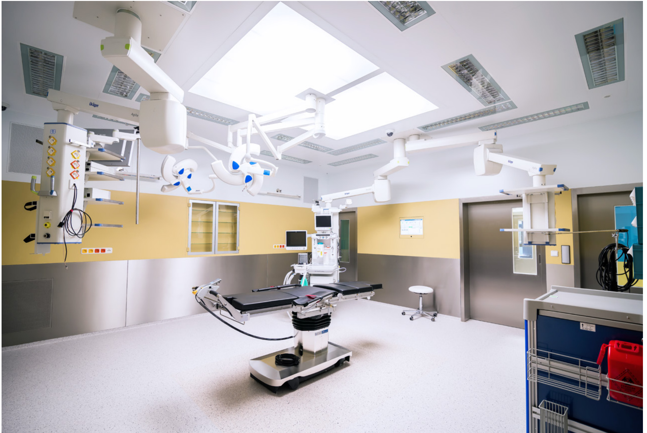
Operating Centre – extension of the Košice Hospital Annex Building - Šaca a.s. | Nemocnica Košice – Šaca, a.s. | Košice, Slovakia | 2015