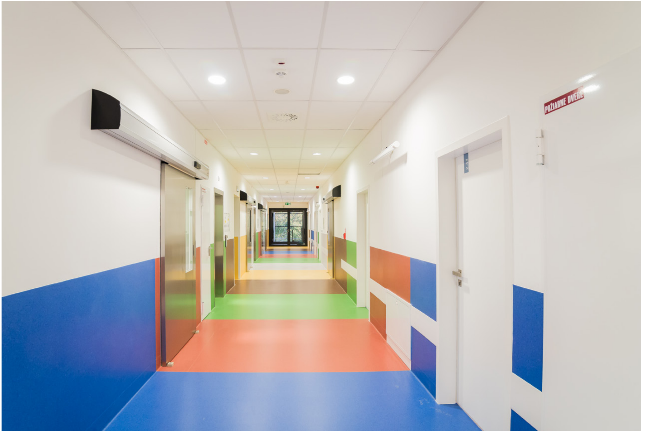
Operating Centre – extension of the Košice Hospital Annex Building - Šaca a.s. | Nemocnica Košice – Šaca, a.s. | Košice, Slovakia | 2015