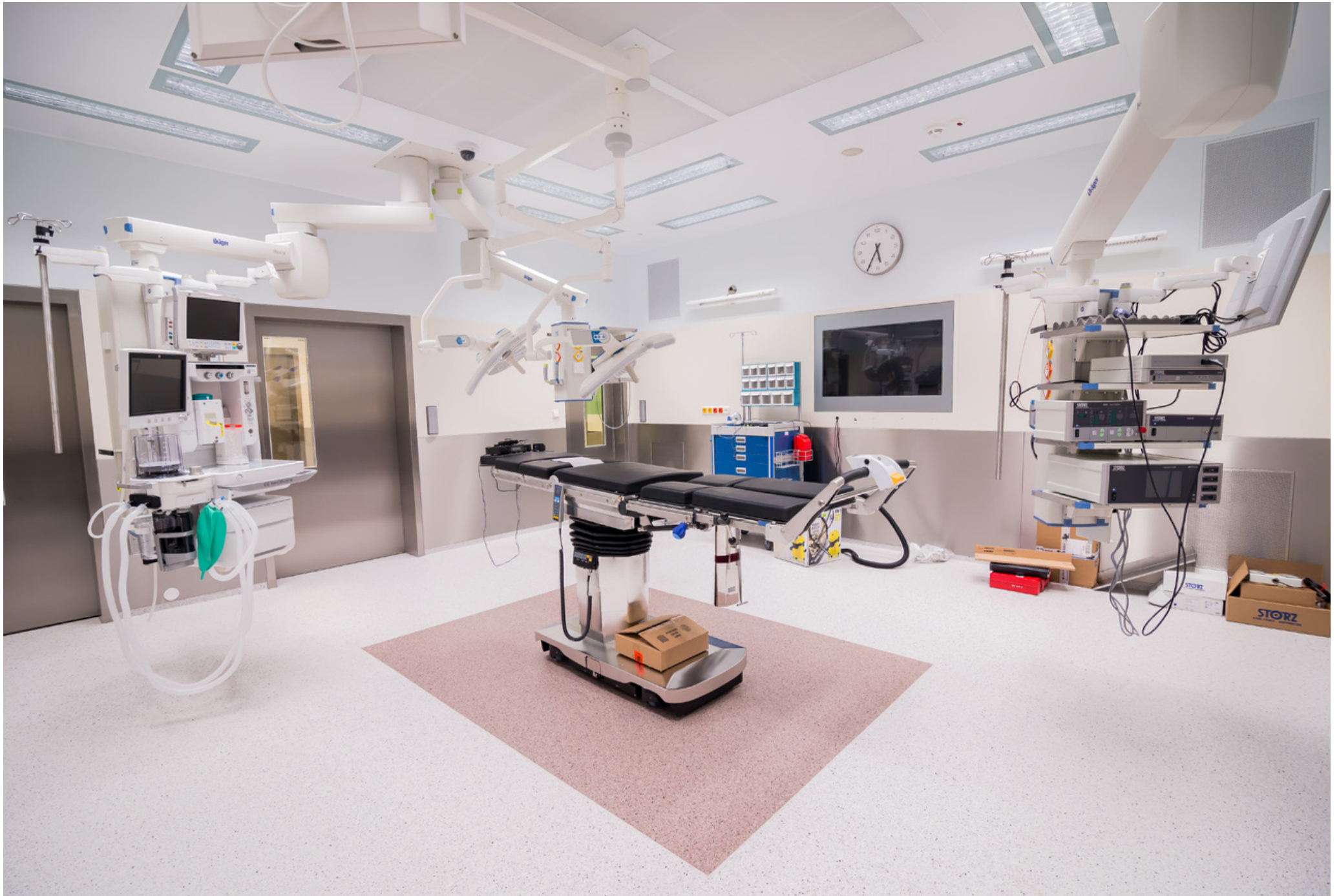
Operating Centre – extension of the Košice Hospital Annex Building - Šaca a.s. | Nemocnica Košice – Šaca, a.s. | Košice, Slovakia | 2015