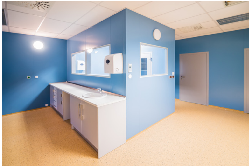
Operating Centre – extension of the Košice Hospital Annex Building - Šaca a.s. | Nemocnica Košice – Šaca, a.s. | Košice, Slovakia | 2015