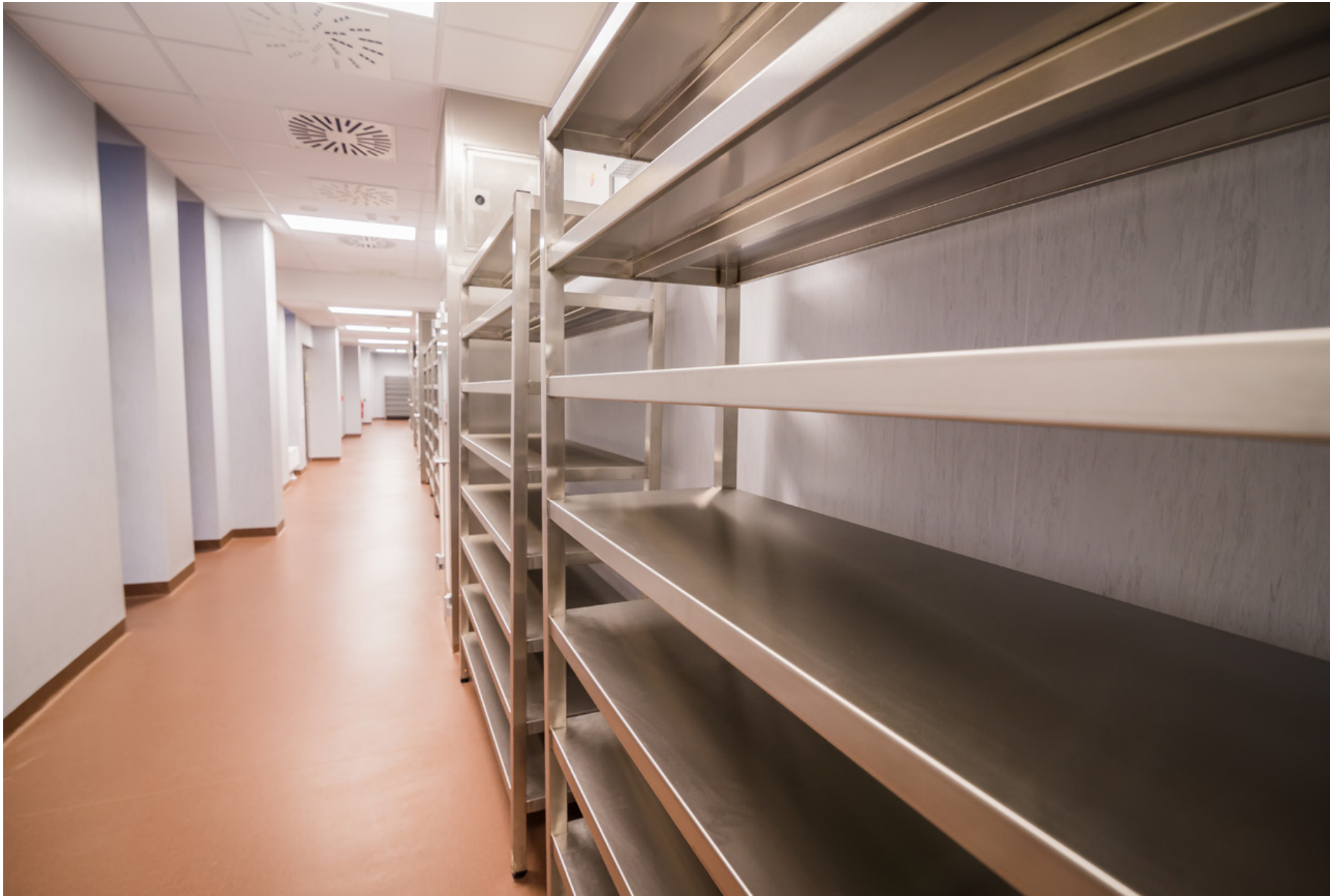
Operating Centre – extension of the Košice Hospital Annex Building - Šaca a.s. | Nemocnica Košice – Šaca, a.s. | Košice, Slovakia | 2015