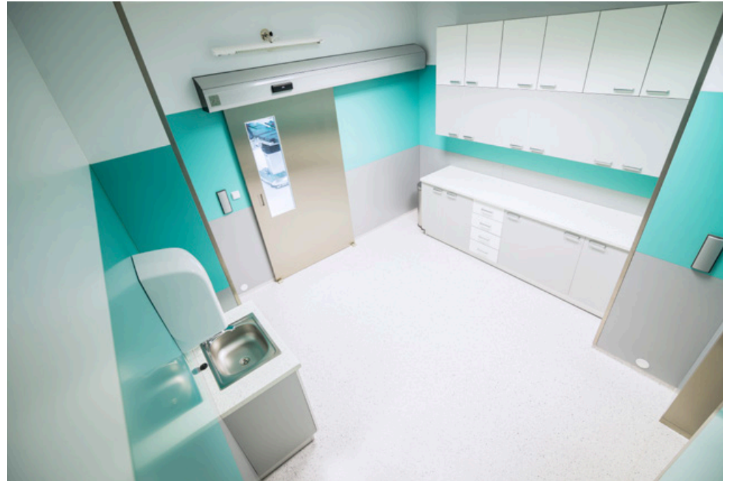
Operating Centre – extension of the Košice Hospital Annex Building - Šaca a.s. | Nemocnica Košice – Šaca, a.s. | Košice, Slovakia | 2015