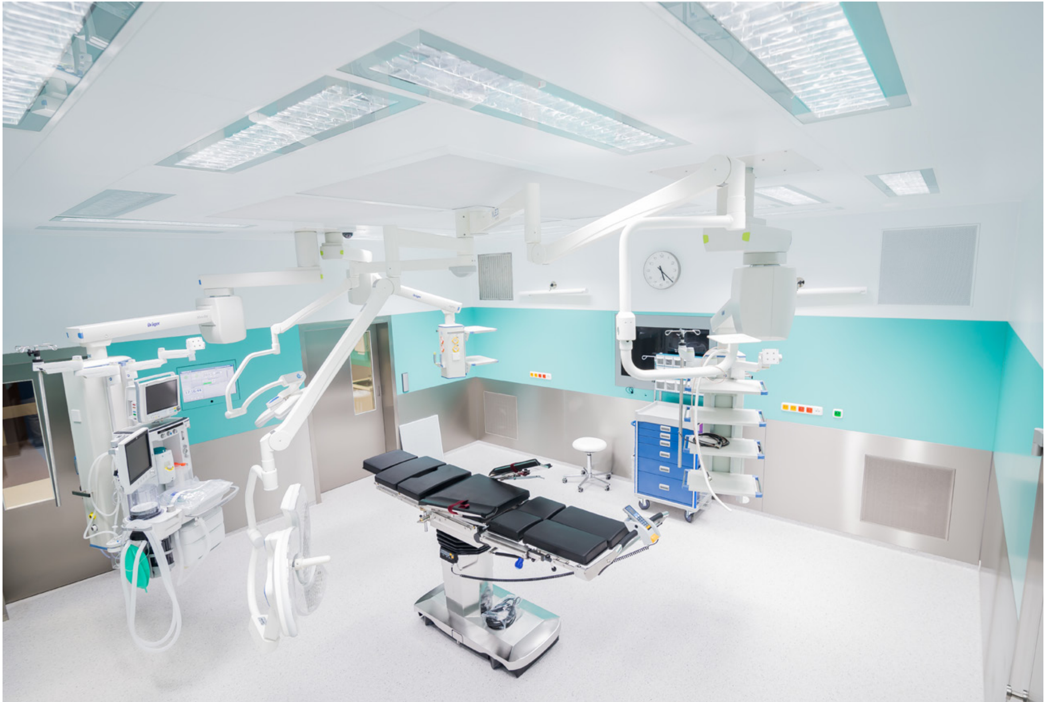
Operating Centre – extension of the Košice Hospital Annex Building - Šaca a.s. | Nemocnica Košice – Šaca, a.s. | Košice, Slovakia | 2015