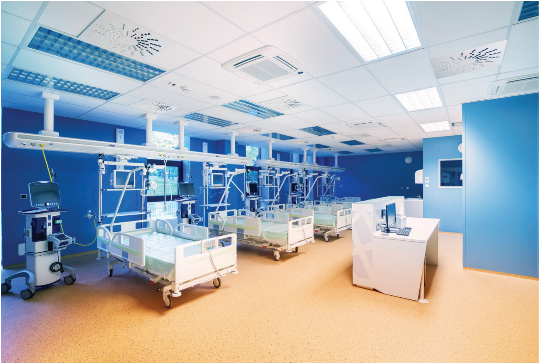
Operating Centre – extension of the Košice Hospital Annex Building - Šaca a.s. | Nemocnica Košice – Šaca, a.s. | Košice, Slovakia | 2015