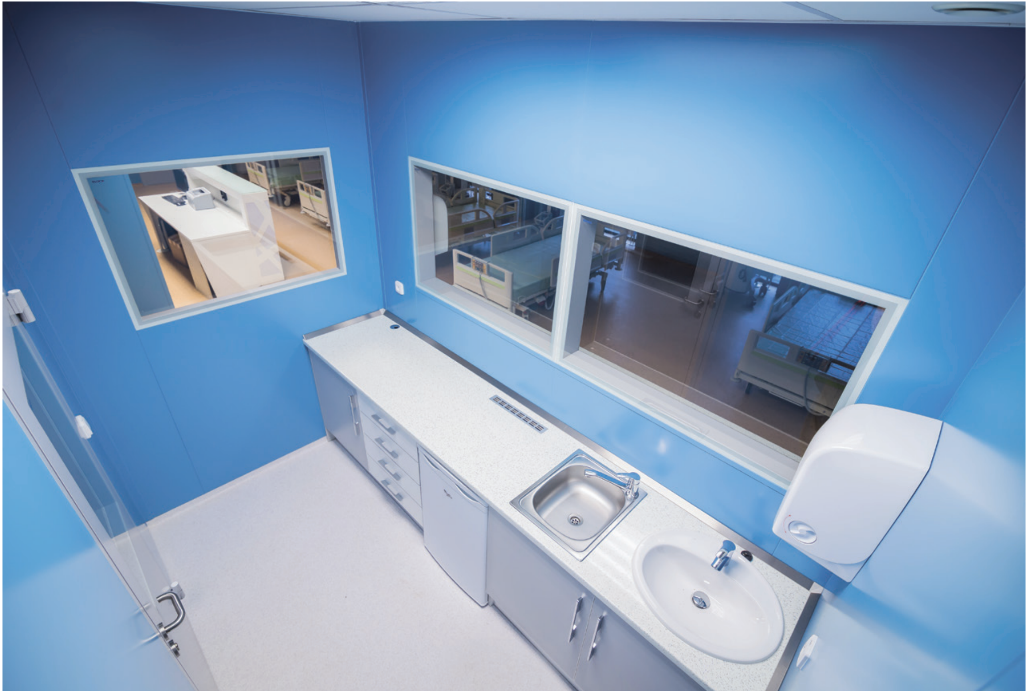
Operating Centre – extension of the Košice Hospital Annex Building - Šaca a.s. | Nemocnica Košice – Šaca, a.s. | Košice, Slovakia | 2015