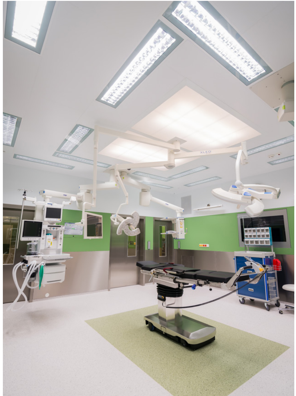
Operating Centre – extension of the Košice Hospital Annex Building - Šaca a.s. | Nemocnica Košice – Šaca, a.s. | Košice, Slovakia | 2015