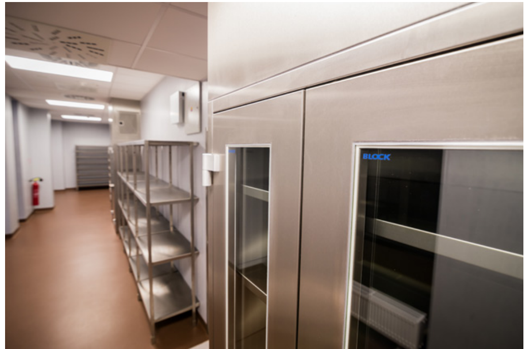
Operating Centre – extension of the Košice Hospital Annex Building - Šaca a.s. | Nemocnica Košice – Šaca, a.s. | Košice, Slovakia | 2015