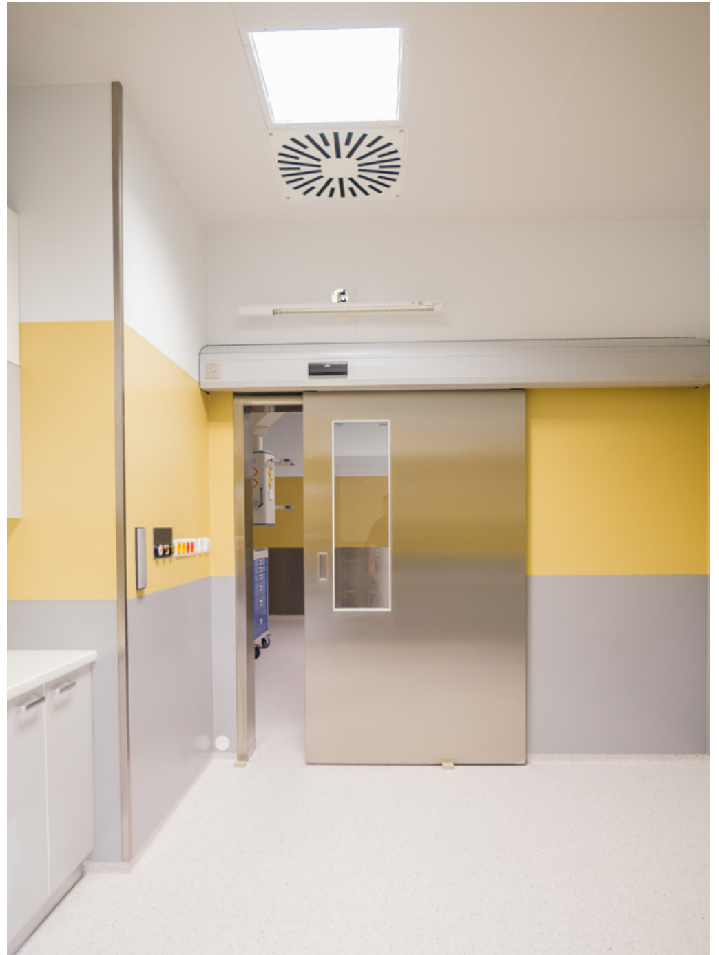
Operating Centre – extension of the Košice Hospital Annex Building - Šaca a.s. | Nemocnica Košice – Šaca, a.s. | Košice, Slovakia | 2015