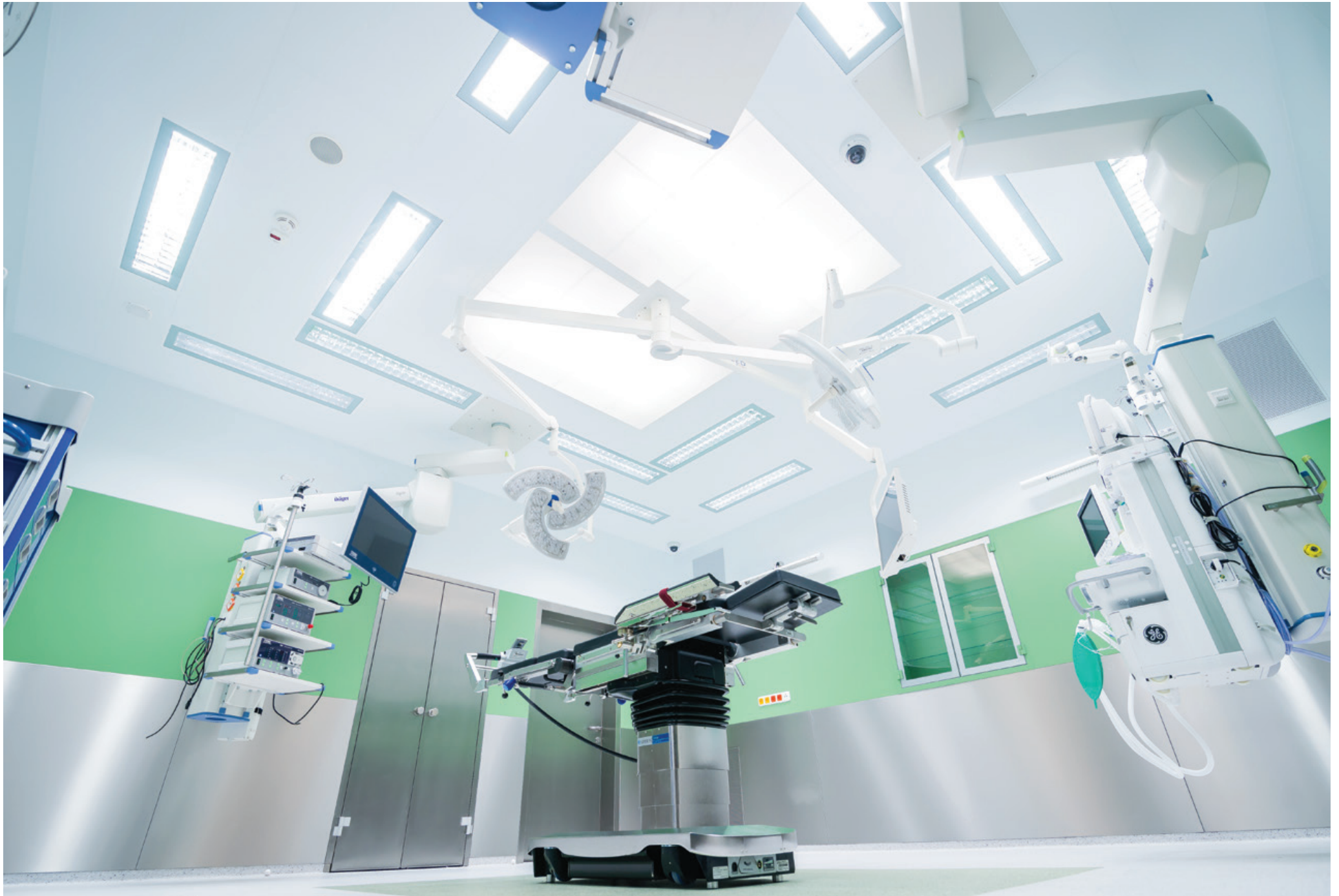
Operating Centre – extension of the Košice Hospital Annex Building - Šaca a.s. | Nemocnica Košice – Šaca, a.s. | Košice, Slovakia | 2015