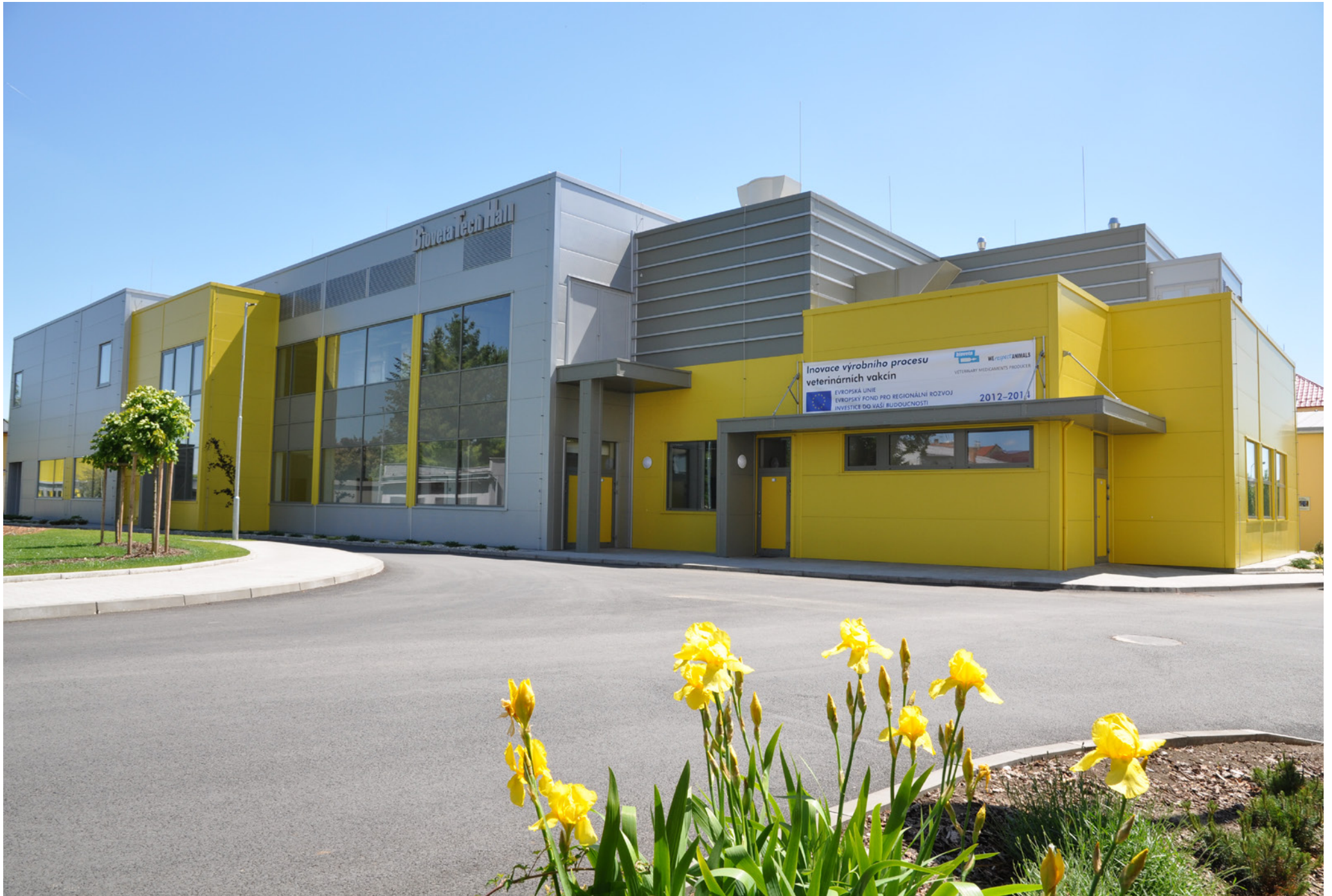
Biotechnological Hall (BTH) | Bioveta, a.s. | Ivanovice na Hané, Czech Republic | 2014