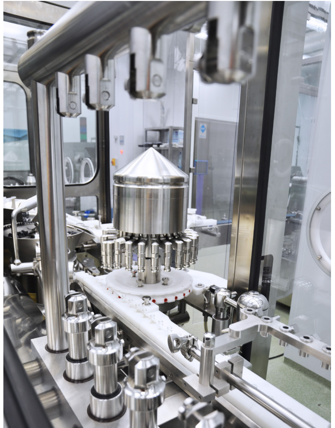
Biotechnological Hall (BTH) | Bioveta, a.s. | Ivanovice na Hané, Czech Republic | 2014