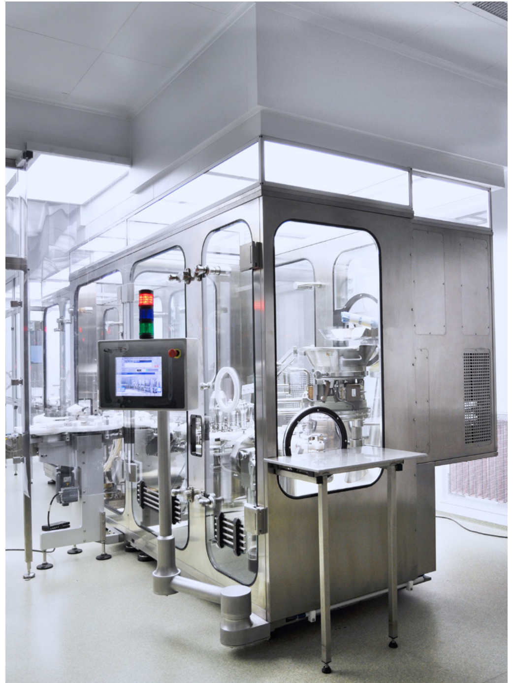
Biotechnological Hall (BTH) | Bioveta, a.s. | Ivanovice na Hané, Czech Republic | 2014