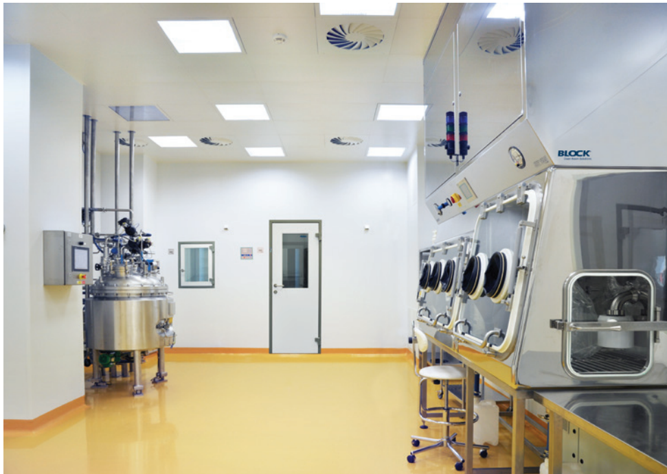
Biotechnological Hall (BTH) | Bioveta, a.s. | Ivanovice na Hané, Czech Republic | 2014