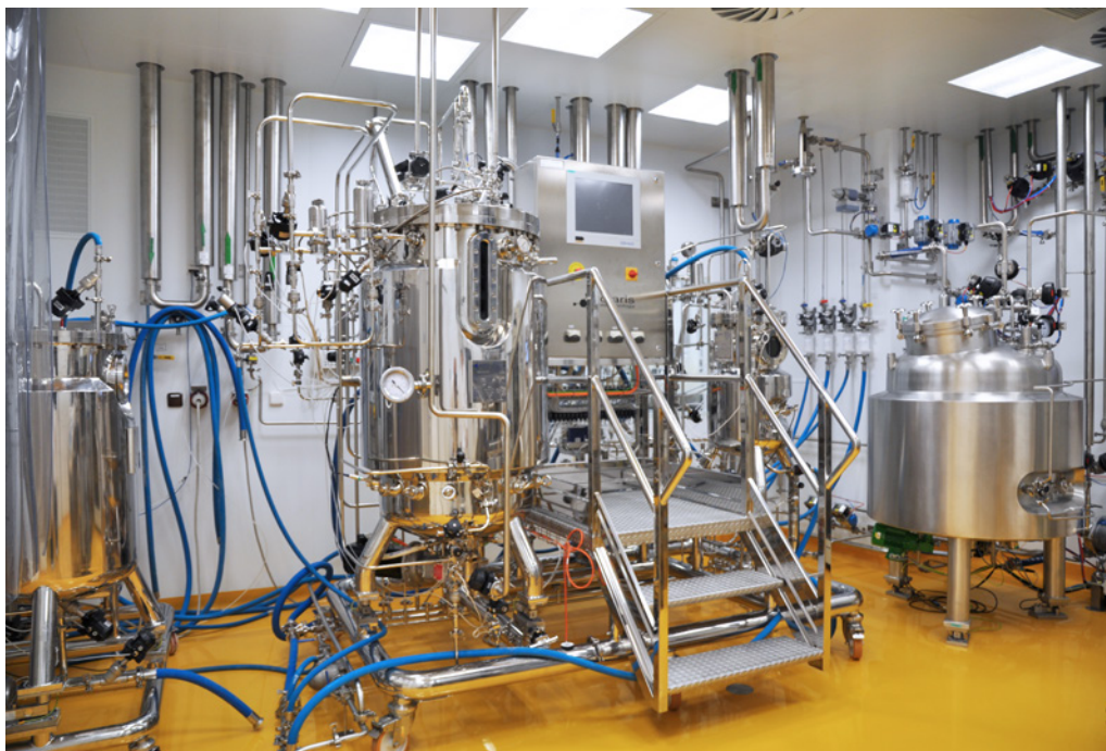
Biotechnological Hall (BTH) | Bioveta, a.s. | Ivanovice na Hané, Czech Republic | 2014