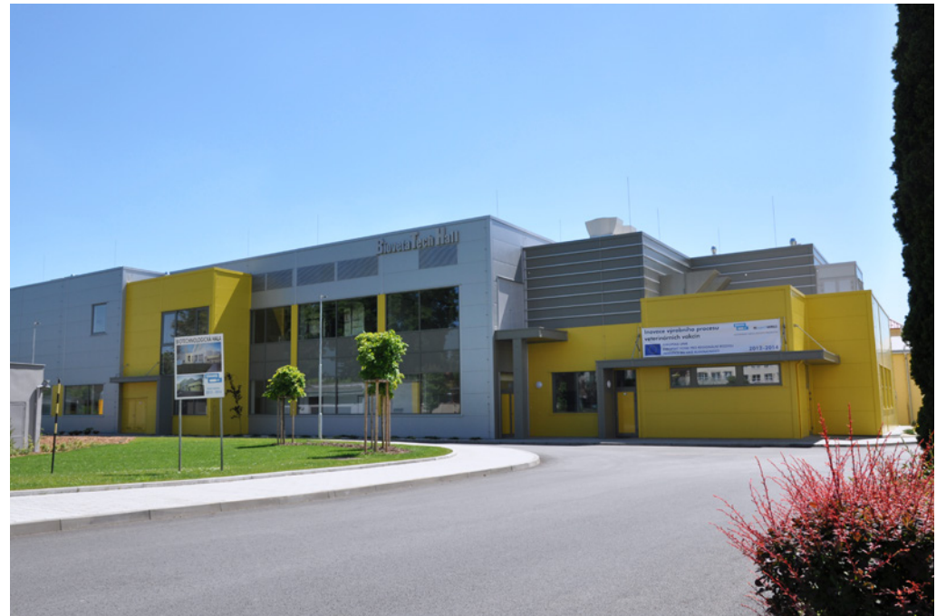
Biotechnological Hall (BTH) | Bioveta, a.s. | Ivanovice na Hané, Czech Republic | 2014