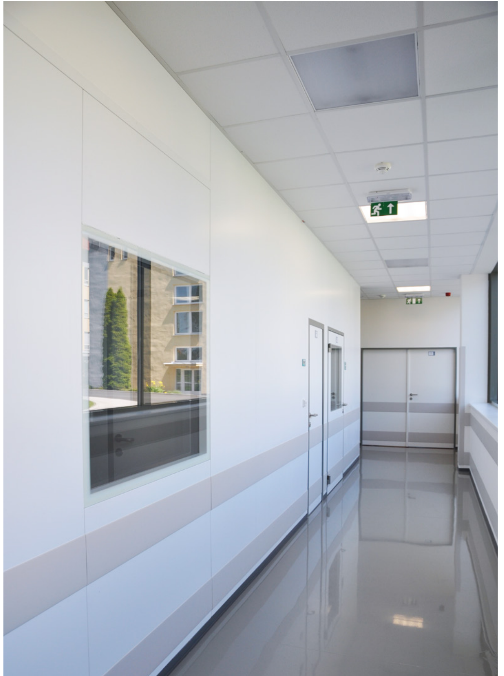
Biotechnological Hall (BTH) | Bioveta, a.s. | Ivanovice na Hané, Czech Republic | 2014