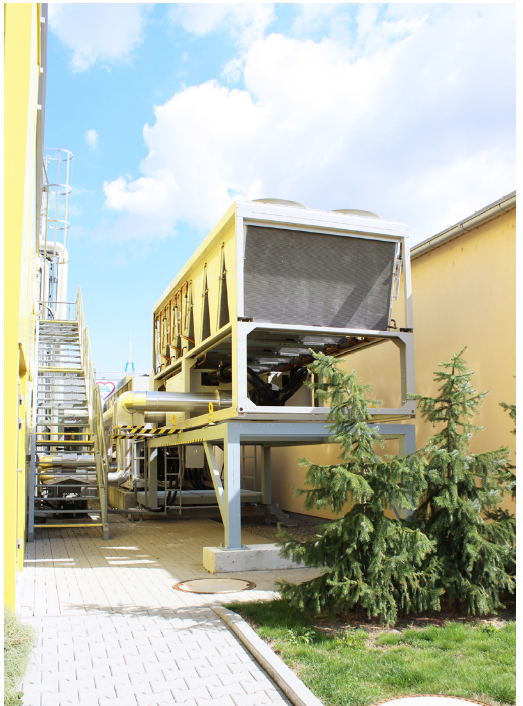
Supply, Installation, and Commissioning of cleanroom technology; Bioveta, a.s., Ivanovice na Hané, Czech Republic; 2019