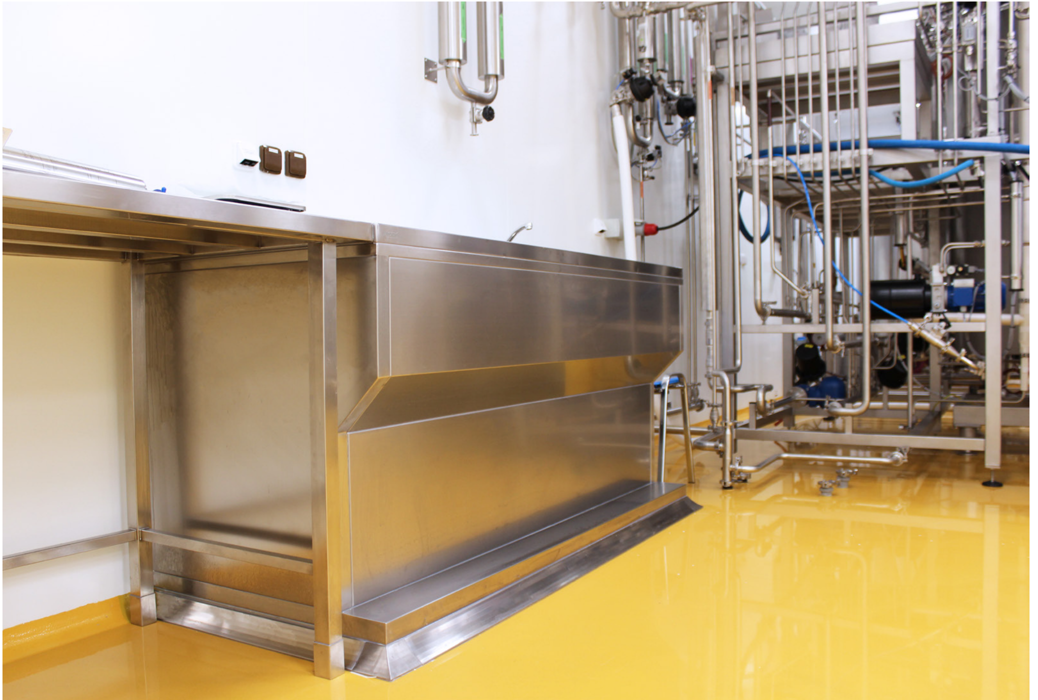
Supply, Installation, and Commissioning of cleanroom technology; Bioveta, a.s., Ivanovice na Hané, Czech Republic; 2019