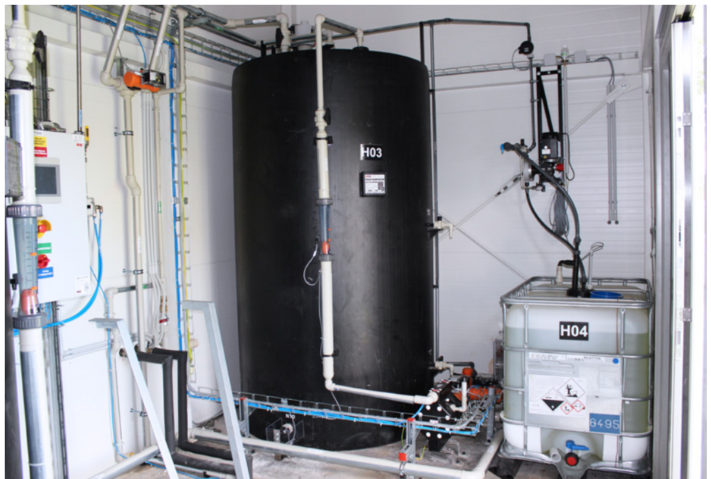
Supply, Installation, and Commissioning of cleanroom technology; Bioveta, a.s., Ivanovice na Hané, Czech Republic; 2019