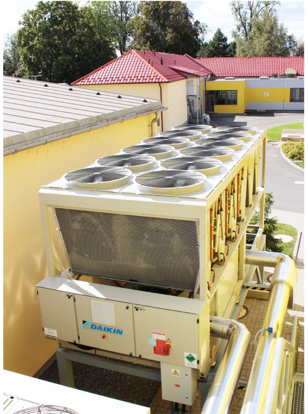
Supply, Installation, and Commissioning of cleanroom technology; Bioveta, a.s., Ivanovice na Hané, Czech Republic; 2019