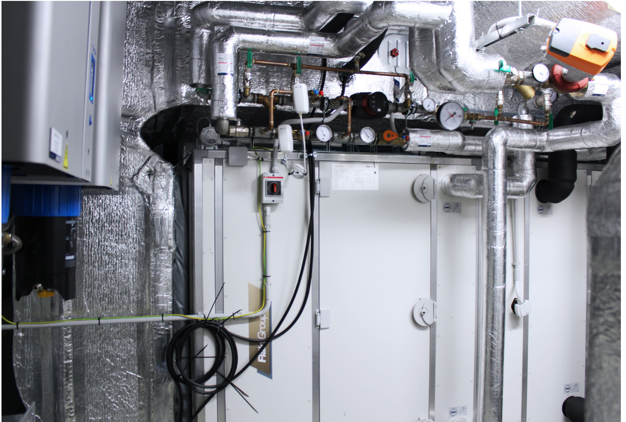
Supply, Installation, and Commissioning of cleanroom technology; Bioveta, a.s., Ivanovice na Hané, Czech Republic; 2019