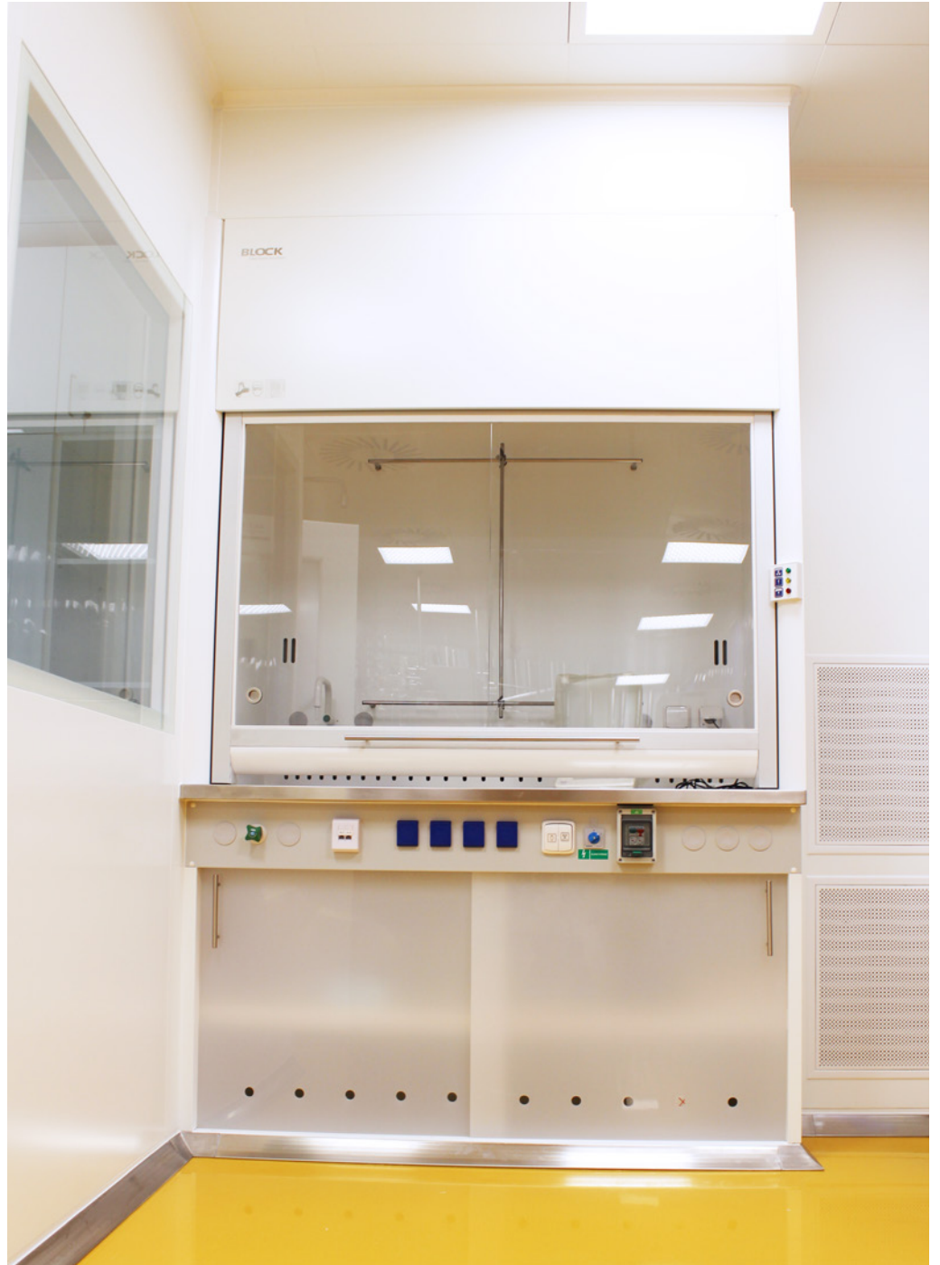
Supply, Installation, and Commissioning of cleanroom technology; Bioveta, a.s., Ivanovice na Hané, Czech Republic; 2019