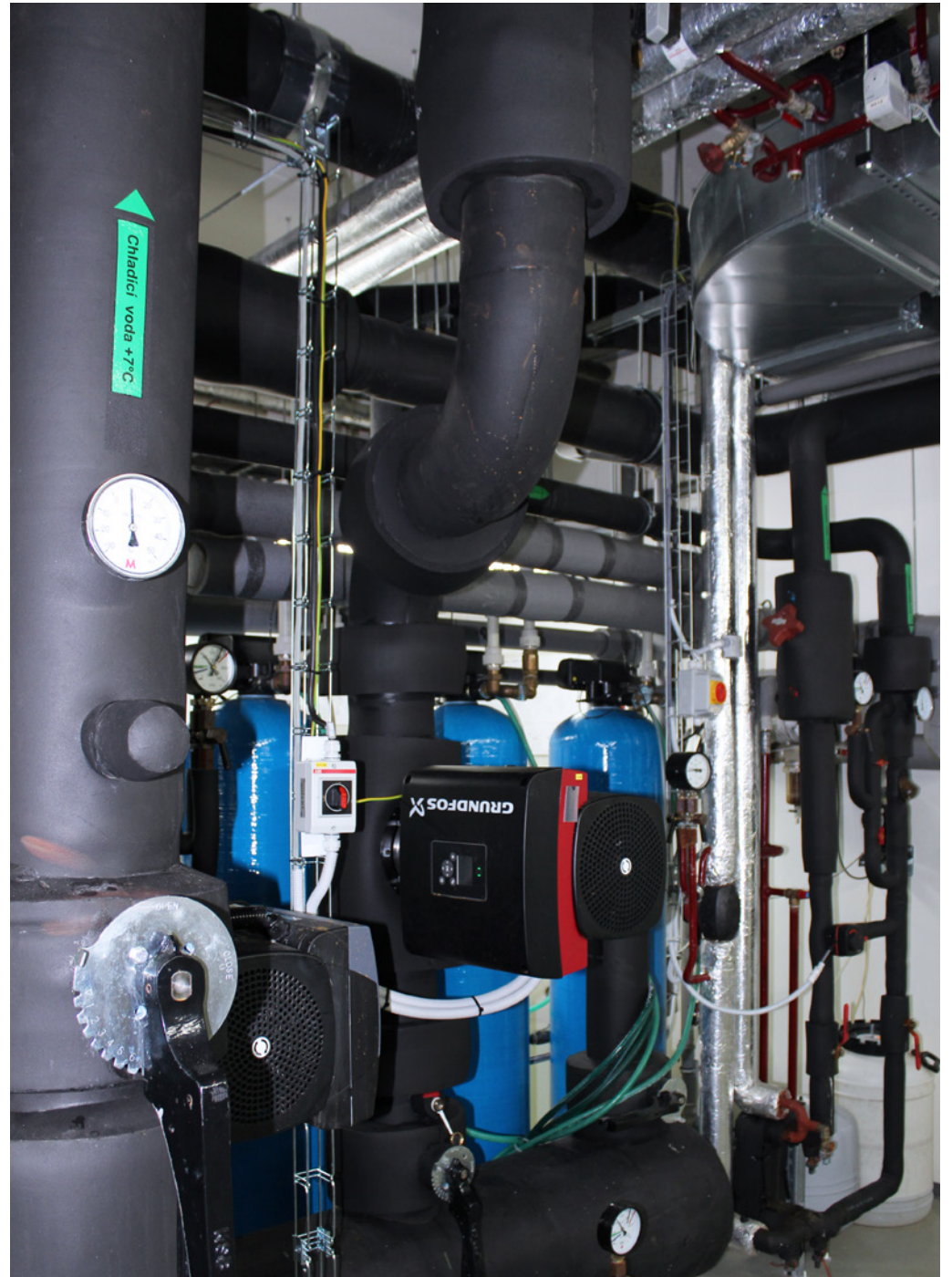
Supply, Installation, and Commissioning of cleanroom technology; Bioveta, a.s., Ivanovice na Hané, Czech Republic; 2019