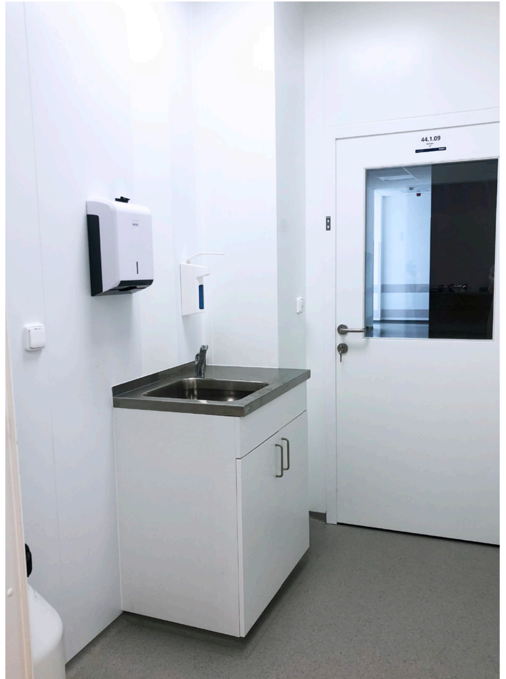
Supply, Installation, and Commissioning of cleanroom technology; Bioveta, a.s., Ivanovice na Hané, Czech Republic; 2019