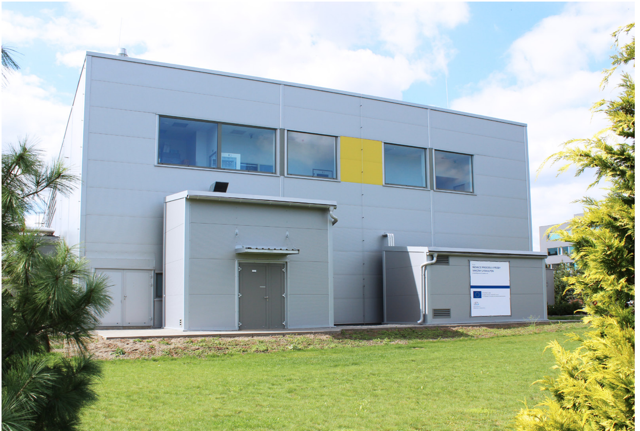
Supply, Installation, and Commissioning of cleanroom technology; Bioveta, a.s., Ivanovice na Hané, Czech Republic; 2019