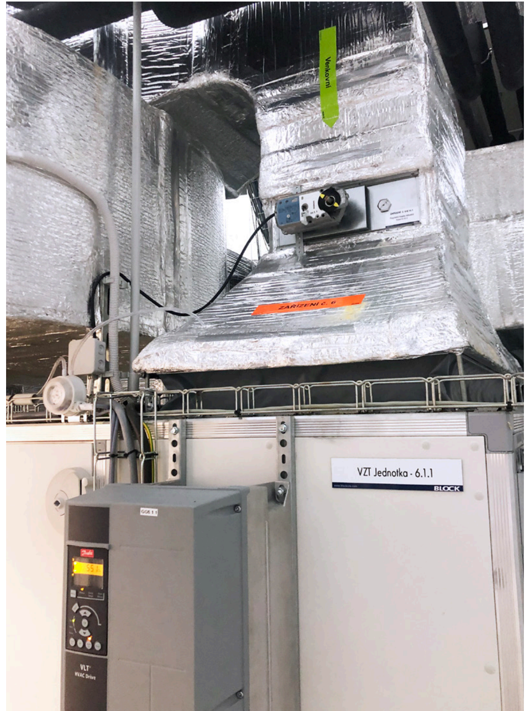
Supply, Installation, and Commissioning of cleanroom technology; Bioveta, a.s., Ivanovice na Hané, Czech Republic; 2019