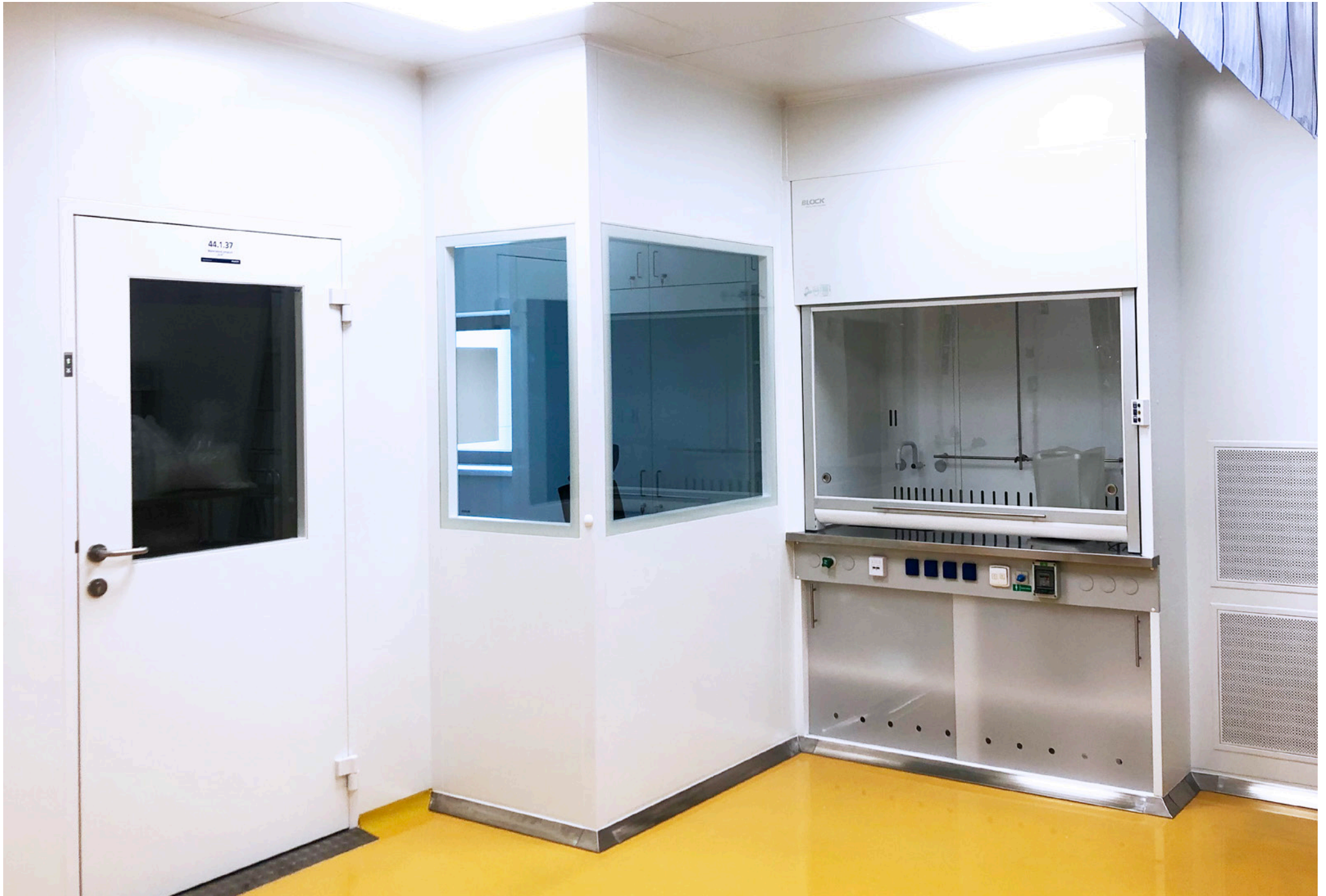
Supply, Installation, and Commissioning of cleanroom technology; Bioveta, a.s., Ivanovice na Hané, Czech Republic; 2019