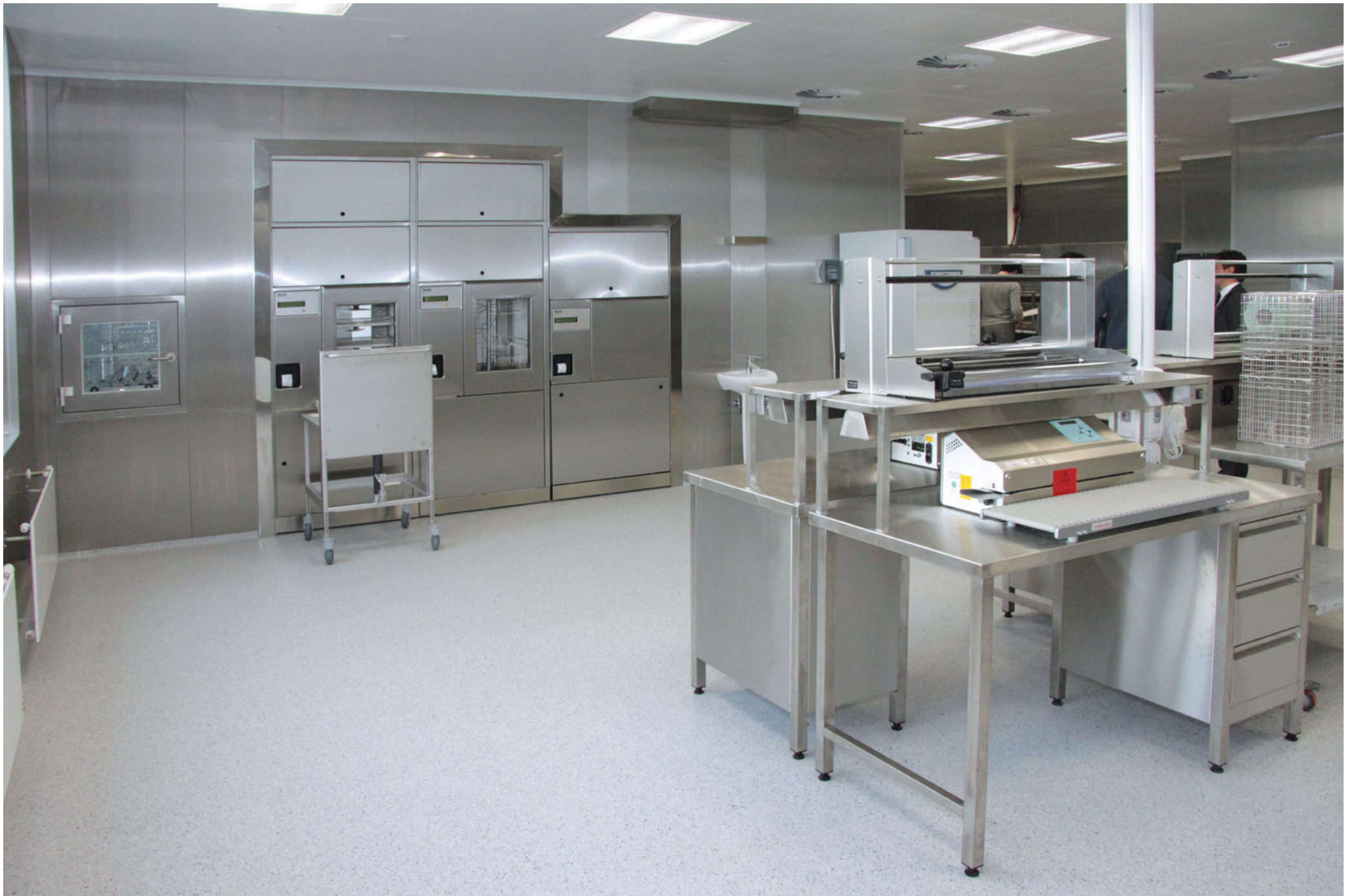
Endocrinological Educational Center | Moscow | Russian Federation | 2014